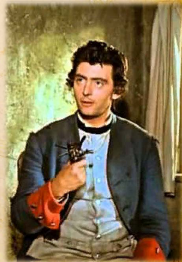
Кадры из фильма-сказки «Огниво» (ГДР, 1959 год.)