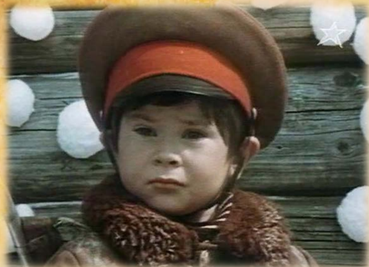
Кадры из фильма «Недопёсок Наполеон III» (СССР, 1978)